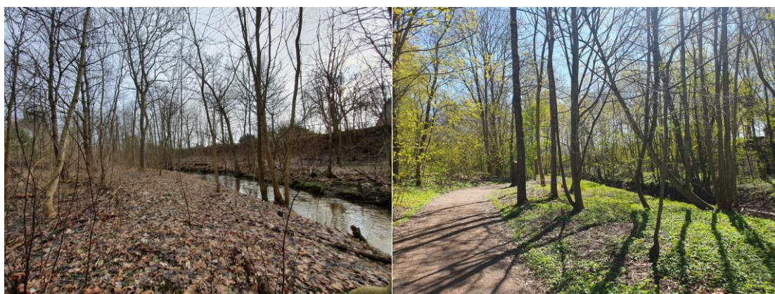
Bild 4. T.v. Innan anläggning hösten 2022; T.h. Efter anläggning våren 2023.