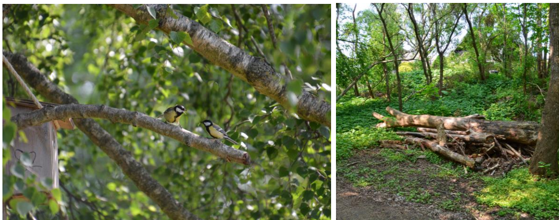
Bild 6. T.v. Fågelholk och häckande talgoxar; T.h. En hög av död ved som lämnats för att gynna insekter, mossor, lavar, svampar och som utgör övervintring för b.la. amfibier.

Utmed promenadslingen har också bänkar placerats ut där man kan sitta och njuta av den omgivande naturen (bild 8), samt en anlagd grillplats vid den östra entrén (bild 9). För att gynna den biologiska mångfalden har fågelholkar (32 st, av olika storlek) satts upp (bild 6 & 8), blommande träd, rishögar och död ved har sparats längs promenadslingen (bild 6). Att slingan är anlagd utan belysning är också det ett beslut för att gynna mångfalden i området då artificiellt ljus har stor påverkan på naturområden, framförallt längs vattendrag som bildar mörka korridorer i landskapet. Något som informeras om på den stora informationsskylten (bild 5).