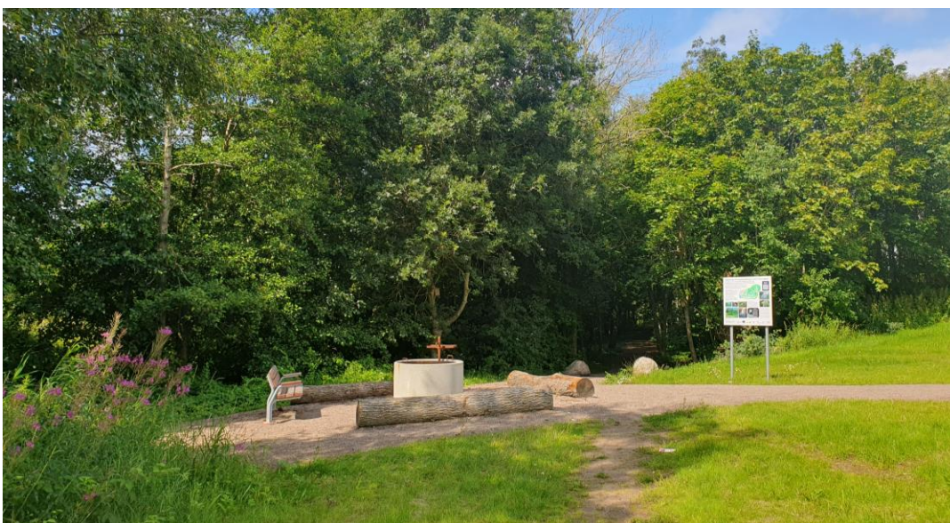
Bild 9. Den anlagda grillplatsen vid den östra entrén.