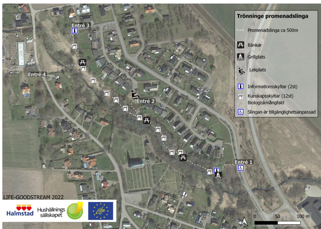
Bild 3. Detaljerad kartbild över promenadslingan med bänkar, skyltar och grillplats.

Därför är kunskapsspridning ett stort fokus och 12 stycken informationsskyltar finns utplacerade längs sträckningen som beskriver djurlivet, vattendraget och åtgärder gemene man kan göra för att gynna den biologiska mångfalden i sin närmiljö (bild 3 & 7).