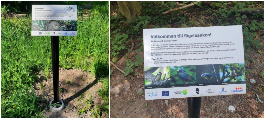
Bild 7. 12 st skyltar finns uppsatta som beskriver djurlivet längs Trönningeån, vattendraget och vad man som privat person kan göra för biologisk mångfald.