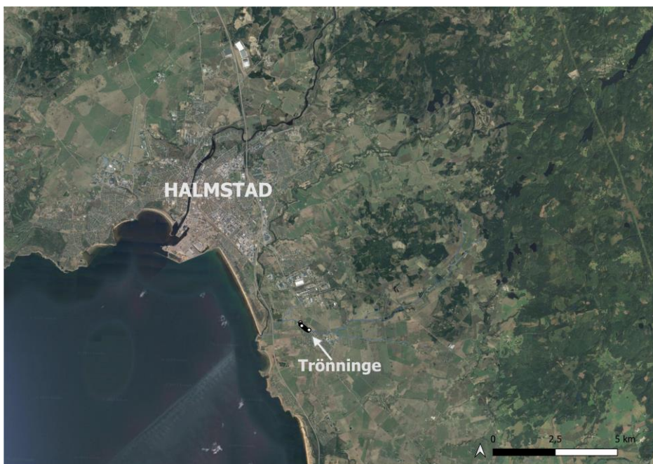
Bild 1. Översiktskarta, Trönninge ligger strax söder om Halmstad invid väg 15 mot Laholm.

Promenadstigen utmed Trönningeån i Trönninge samhälle är en ca 500 meter lång, handikappanpassad promenadstig med 4 entréer (bild 2 & 3). Promenadslingan anlades hösten 2022, och har av Halmstad kommun, under våren 2023 (bild 4), kompletterats med en bro över ån i västra änden. Promenadslingan har som syfte att ge Trönningeborna en möjlighet att komma sin natur lite närmare och få ökad förståelse för dess värde.