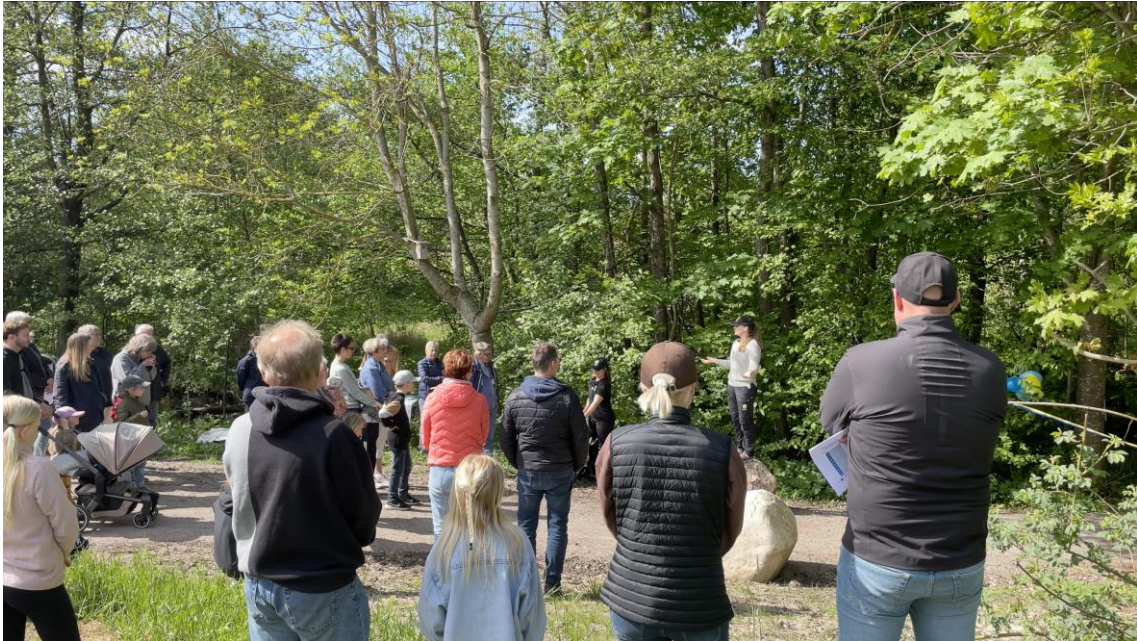
Bild 10. Bild från 17 maj när promenadslingan invigdes och över 200 intresserade besökare var på plats och deltog i de olika aktiviteterna eller njöt av promenaden.

Den här rapporten har presenterat en uppföljning av LIFE Goodstreams och Halmstad Kommuns anlagda promenadstig utmed Trönningeån i Trönninge samhälle. Sammanfattningsvis har promenadstigen kommit att bli en mycket omtyckt och välbesökt ny del av Trönninge samhälle, vilket har reflekterats genom denna undersökning. Förhoppningarna är att promenadstigen fortsätter bidra med härliga naturupplevelser och ökad förståelse av de biologiska värdena.