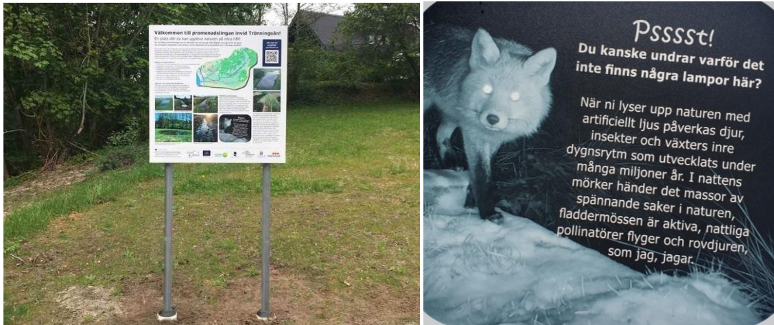
Bild 5. T.v. Stor informationstavla finns vid de två huvudingångarna i varje ände; T.h. Information om belysning.

Utmed promenadslingen har också bänkar placerats ut där man kan sitta och njuta av den omgivande naturen (bild 8), samt en anlagd grillplats vid den östra entrén (bild 9). För att gynna den biologiska mångfalden har fågelholkar (32 st, av olika storlek) satts upp (bild 6 & 8), blommande träd, rishögar och död ved har sparats längs promenadslingen (bild 6). Att slingan är anlagd utan belysning är också det ett beslut för att gynna mångfalden i området då artificiellt ljus har stor påverkan på naturområden, framförallt längs vattendrag som bildar mörka korridorer i landskapet. Något som informeras om på den stora informationsskylten (bild 5).