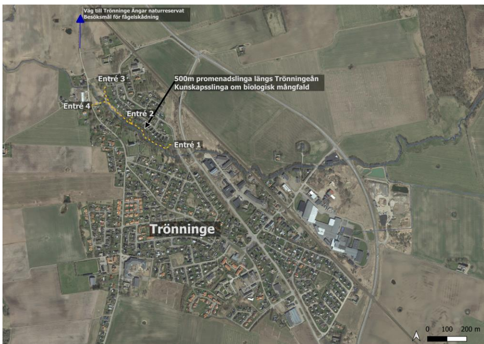
Bild 2. Promenadslingans sträckning i Trönninge samhälle

Promenadstigen utmed Trönningeån i Trönninge samhälle är en ca 500 meter lång, handikappanpassad promenadstig med 4 entréer (bild 2 & 3). Promenadslingan anlades hösten 2022, och har av Halmstad kommun, under våren 2023 (bild 4), kompletterats med en bro över ån i västra änden. Promenadslingan har som syfte att ge Trönningeborna en möjlighet att komma sin natur lite närmare och få ökad förståelse för dess värde.